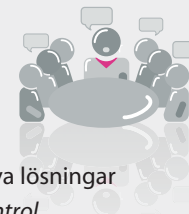
ABB:s utveckling av verksamheten i Sverige

Hand i hand med marknadens krav på energieffektiva lösningar